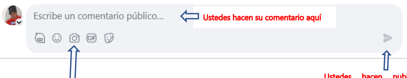
Ustedes hacen clic en este botón que representa una cámara y buscan dentro de su dispositivo donde se encuentra la imagen que desean adjuntar y le dan clic