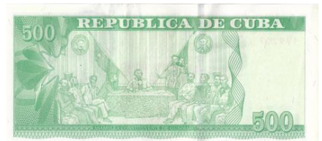
Reverso billetes emitidos en el 2010-2018-2021-2022-2023