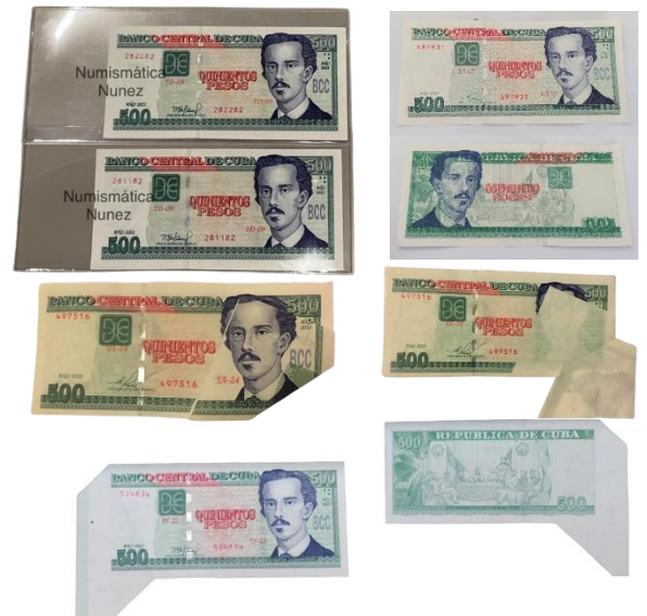
Les invito para que ustedes clasifiquen estos errores de los que ACLARO que estas imágenes son una recopilación. Algunas de ellas tratadas por distinguidos colegas y aficionados, en una serie de publicaciones que han realizados, en los Grupos de Numismática, en sus páginas web, y perfiles de la Maravillosa Red Facebook, Instagram y otros sitios web.

Les muestro como pueden insertar su imagen al hacer su comentario.