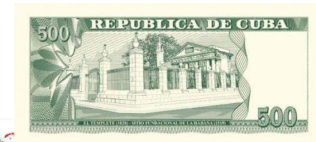
Reverso billete conmemorativo emitido en el 2019