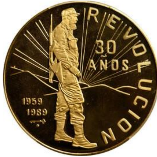
Moneda conmemorativa denominación 100 pesos. 30 aniversario de la Revolución Cubana. Anverso. Fidel Castro sobre un fondo de amanecer sobre montañas que representan la Sierra Maestra; Fechas y marca de ceca a la izquierda. Rotulación: REVOLUCION 30 AÑOS 1959-1989.

Si estás interesado en coleccionar o aprender más sobre estas piezas, te recomendaría visitar exposiciones numismáticas en Cuba o consultar catálogos especializados en monedas y billetes cubanos.