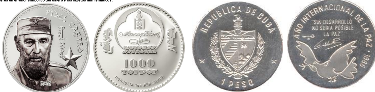
Esta moneda de plata de 1 onza, con un acabado de prueba, celebra el legado de Fidel Castro, el líder revolucionario. Moneda Proof de Plata Fidel Castro Cuba 2017 de 1oz. Esta pieza de colección, acuñada en plata pura con su diseño en alto relieve elaborado con la avanzada tecnología de acuñación inteligente, con smartminting®, es una obra maestra del arte numismático.