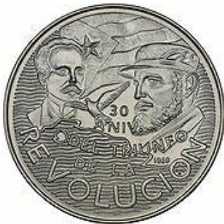
5 pesos J. Martí and F. Castro; Trial strike. Anverso. Escudo de Cuba, nombre del país como leyenda curva en la parte superior, valor facial debajo, peso y ley en los laterales. Reverso. Martí cabeza 3/4 derecha, a la izquierda, Fidel cabeza 3/4 izquierda, a la derecha. Bandera cubana entre ellos, arriba, paloma volante entre las figuras. Debajo figuras con forma de la costa sur de Cuba, y parte inferior y laterales con líneas onduladas, simbolizando el Mar Caribe. Leyenda 5 líneas que crecen desde el centro hacia el borde inferior. Año de emisión debajo de la cabeza de Castro, marca de ceca dentro de la última "o" de la leyenda. Leyenda: 30 ANIV. DEL TRIUNFO 1989 DE LA REVOLUCION. NOTA: Esta moneda fue una acuñación de prueba no aceptada. Sólo se acuñó una moneda.