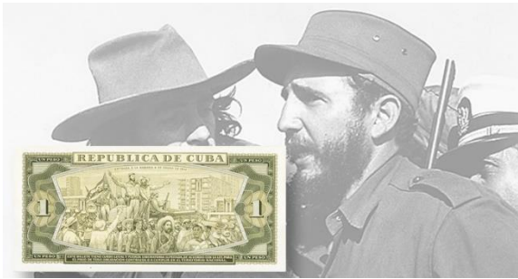
Fidel Castro, a la derecha, encabeza la procesión hacia La Habana el 8 de enero de 1959, acompañado por su compatriota Camilo Cienfuegos. Un retrato de Cienfuegos, quien murió en un accidente aéreo el 28 de octubre de 1959, aparece en varias series de billetes cubanos de 20 pesos. La procesión de 1959 está capturada en el reverso de este billete de un peso.