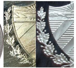
Esta moneda se acuñó con dos anversos diferentes: KM# 241.1, el más antiguo, tiene el escudo de armas más pequeño, la corona más fina y las franjas de la izquierda son todas lisas; KM# 241.2, el más reciente, con el escudo de armas más grande, la corona gruesa y 3 franjas carenadas a la izquierda. Imagen de la variante KM 241.1 a la izquierda, KM 241.2 a la derecha.