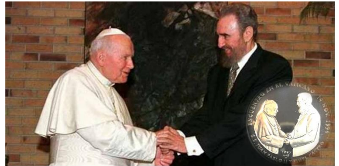
Moneda conmemorativa que presenta un relieve de dos figuras dándose la mano. Las figuras están identificadas por el texto en la moneda como "S.S. JUAN PABLO II Y FIDEL CASTRO". Sobre las figuras, se lee "ENCUENTRO EN EL VATICANO" y debajo, "19 NOV. 1996". Esta moneda conmemora una reunión histórica entre el Papa Juan Pablo II y Fidel Castro, que tuvo lugar el 19 de noviembre de 1996 en el Vaticano. Este encuentro fue significativo ya que simbolizó un momento de diálogo entre la Iglesia Católica y el estado cubano.