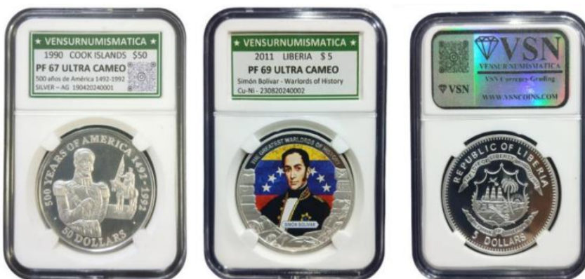
Trabajo de VenSurNumismática: Accesorios y Consumibles Coins & Note Bank