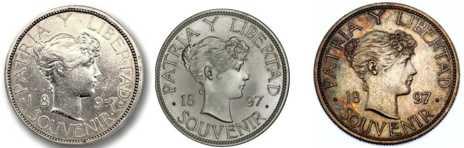
En las imágenes moneda souvenir cubana 1897 en metal de plata. Los tres tipos emitidos. de izquierda a derecha Tipo I al centro tipo II a la derecha tipo III

diáspora y la capacidad de la numismática para vehicular símbolos, recursos y esperanzas nacionales. Su estudio revela la complejidad de los procesos de construcción identitaria en contextos de exilio, la innovación en el uso de la moneda como instrumento de propaganda y recaudación, y la importancia de la iconografía femenina en la representación de la República. Los tres tipos principales, su patrón en bronce (imágenes 1 y 3), la rareza y cotización actual, así como los desafíos de autenticidad y conservación, hacen de esta pieza un objeto de deseo para coleccionistas y un campo fértil para la investigación académica. Su influencia en emisiones simbólicas posteriores y su recepción internacional confirman su estatus como hito de la numismática latinoamericana .