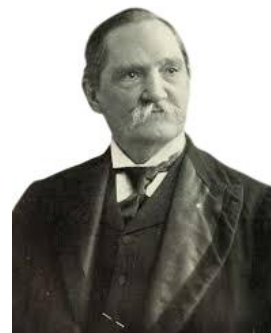
En la imagen Tomás Estrada Palma en nuestro criterio tuvo un papel significativo en la historia numismática de Cuba.